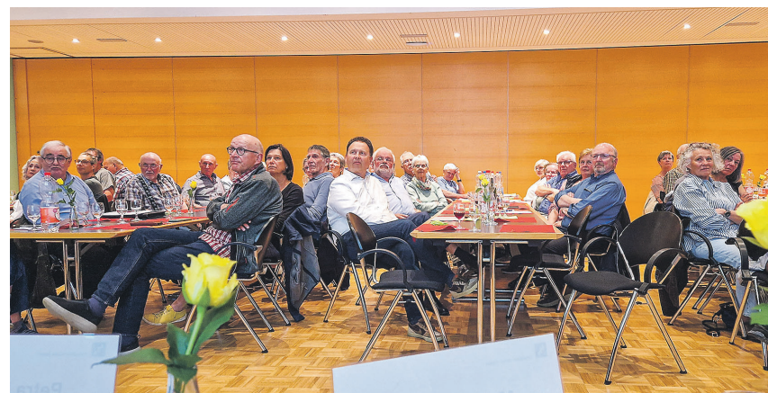
Die Mitglieder des Einwohner-Vereins Aadorf erfreuten sich an der GV im Gemeindezentrum an einem spannenden Rückblick aufs Vereinsjahr.