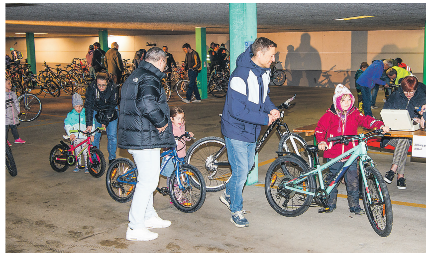
Fahrräder und E-Bikes warten in der Tiefgarage des Aadorfer Gemeindezentrums auf neue Besitzerinnen und Besitzer.

Zum Verkauf stehende konventionelle Fahrräder, Mountain- oder E-Bikes, Kinderfahrzeuge sowie E-Scooter können am Freitag, 27. März, zwischen