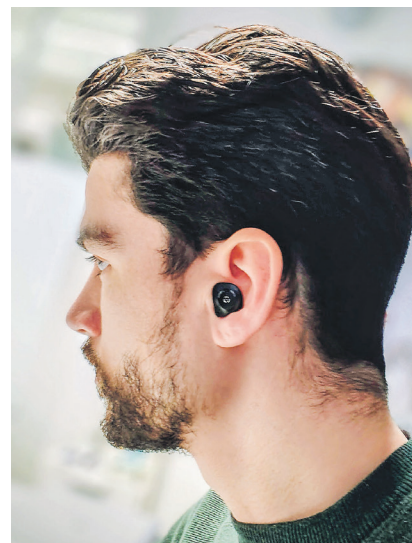
Moderne Hörgeräte verbinden Hörkomfort mit Smartphone-Technologie – für besten Klang direkt im Ohr.

Zugegeben, die Elektronik für die Smartphone-Kopplung braucht viel Platz, weshalb die «IdO-Geräte» mit dieser Ausstattung etwas gross ausfallen. Immer mehr Hörgeräteträger entscheiden sich dennoch für diese Variante, denn es befindet sich nichts hinter dem Ohr, was der Brille in den Weg kommt, und die Hörgeräte sitzen an der