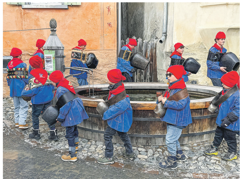
Chalandamarz in Guarda – jeder Brunnen wird umrundet.

Haben auch Sie einen Schnappschuss gemacht? Dann senden Sie Ihr Bild – am liebsten ein Querformat – in Originalgrösse, mit einem kurzen Untertitel (wer, was und wo) und Ihrem Namen mit Wohnort an redaktion@elgger-zeitung.ch .